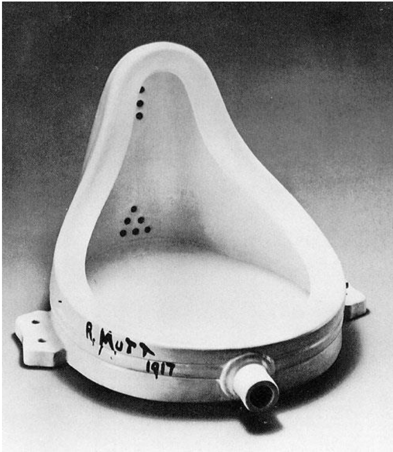
Fontaine - M.Duchamp, 1917

En 1917, Marcel Duchamp présenta une œuvre hors du commun, une œuvre dont la facture n'était pas de lui, un « ready made ». Cette œuvre ne fût pas signée par l'auteur de son propre nom mais de celui de R.Mutt (Mutter – nom qu'il s'est choisi en lien avec la mère, de surcroit et le réel peut être. Il y a donc bien nom, mais né de l'artiste dans sa relation à l'Autre). Par la suite, cette création fût date dans l'histoire de l'art et marqua le « passage » à l'art moderne. Cette création « déjà faite », affublée du nom d'un autre (la mère ou das Ding, selon Lacan) a fait l'objet de la part de Duchamp de la désignation d'œuvre, prenant ainsi le contre-pied de la sacralisation de l'objet d'art (objet usuel, non encadré par l'institution muséale, absence d'auteur...).