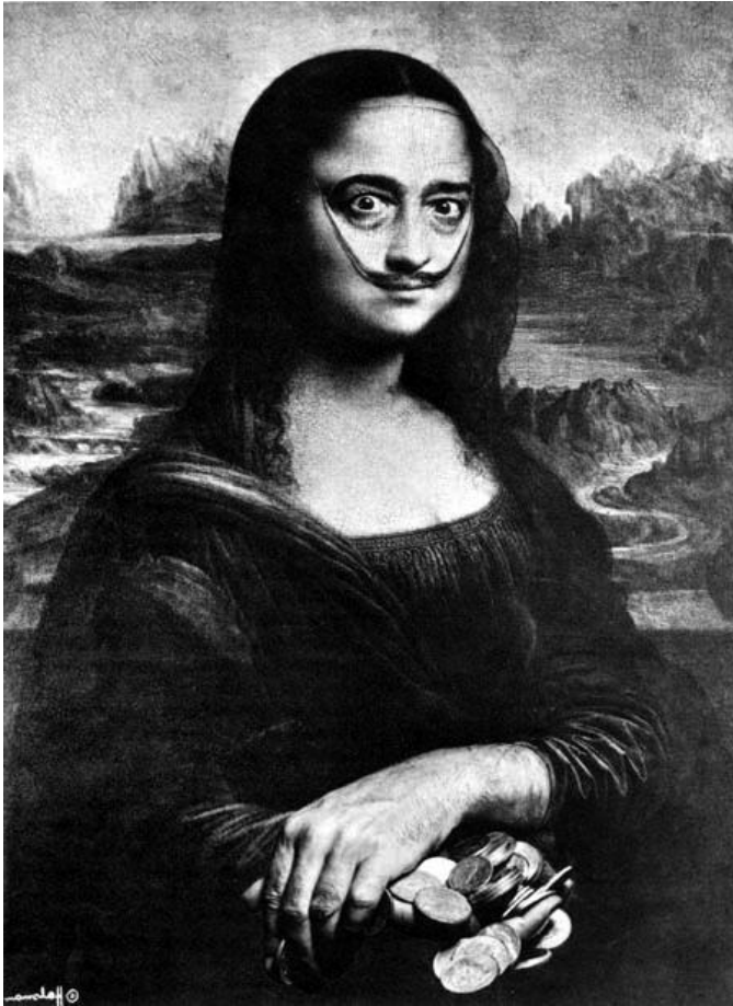
"Autoportrait en Mona Lisa" Salvador Dali, 1954.